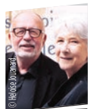
JEAN-FRANÇOIS KAHN ET CLAUDE SCHOPP