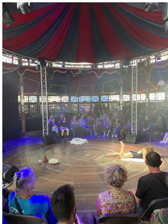
Vue intérieure Magic Mirrors