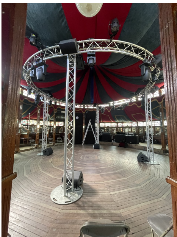
Vue intérieure Magic Mirrors