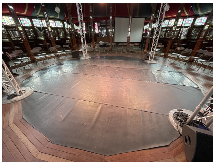
Tapis de danse