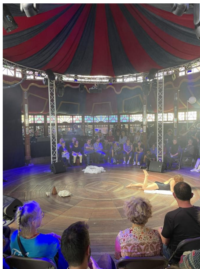
Vue intérieure Magic Mirrors