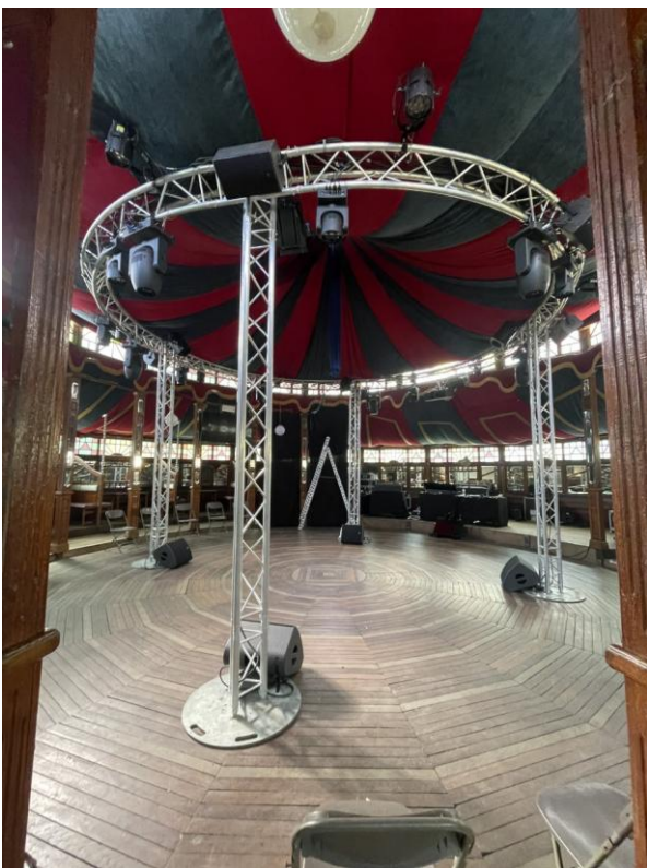
Vue intérieure Magic Mirrors